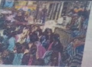
समाचारों में सुनाया स्कूलों ने परिणाम (पेज | 14)