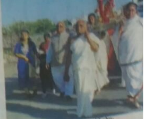
चित्तौड़ दुर्ग पर शुक्रवार को हर धेड़ा में अन्न लेते लोका।