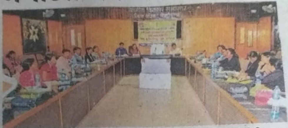
बेटे बचाओ ब्लॉक स्तरीय टास्क फोर्स कार्यशाला में शामिल प्रतिनिधि।