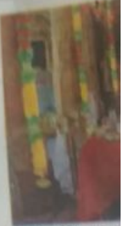
चित्तौड़ दुर्ग विभवा लक्षण भी कई सावक-

समारोह में भाग लेने के लिए चित्तौड़ जिले के अलावा प्रदेश के कई क्षेत्रों के श्रद्धालुओं सहित मुम्बई, उड़ीसा, अहमदाबाद, गुजरात, मध्यप्रदेश आदि क्षेत्रों से भी कई सावक-